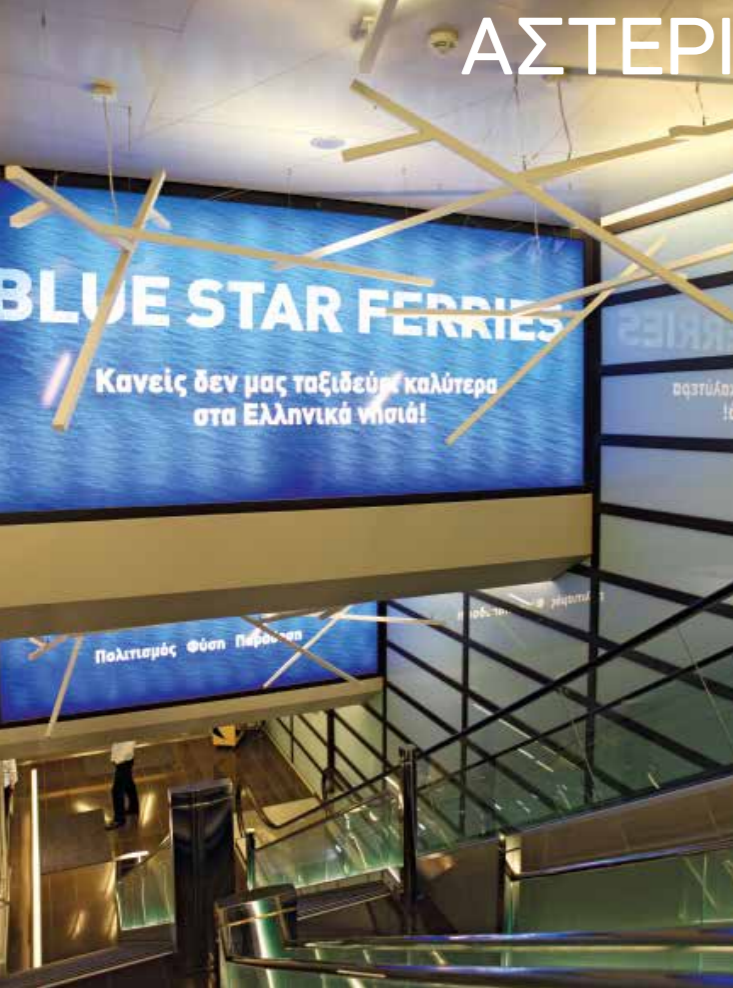
BLUE STAR PATMOS